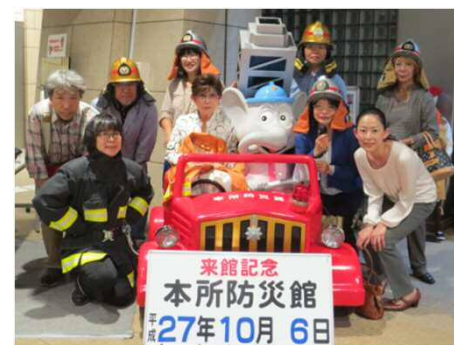
▲ 受付にて記念撮影